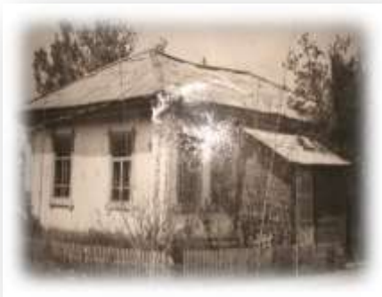
Дом по ул. Серова, где была открыта детская библиотека

В 1950 году было решено открыть детскую библиотеку, и ей выделили место в правой части этого домика. А в левой, соответственно, находилась районная библиотека. Адрес детской библиотеки менялся неоднократно. В 1952 году она обосновалась на улице Почтовая (ныне ул. 35